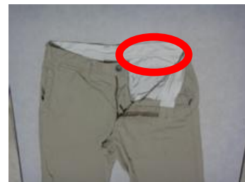
内側の見えやすい場所