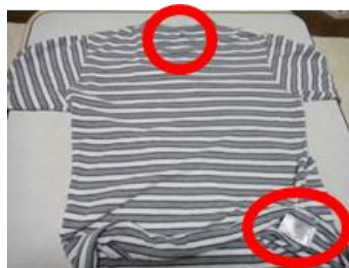
衣類のタグの部分等

持ち込み品は紛失を防ぐために 名前の記入 をお願いします ・衣類はわかりやすい箇所に 油性ペン にてご記入ください ・定期的に文字の薄れをご確認ください (参考例)