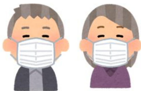
サービス利用時&送迎時は マスクの着用！

三輪医院グループでは、厚生労働省の通達に基づき、利用者様の安全を守るため、3月13日以降も 今までのコロナ対策(マスク着用等)を継続していきます。