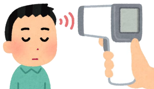
送迎時(サービス利用前) 体温測定