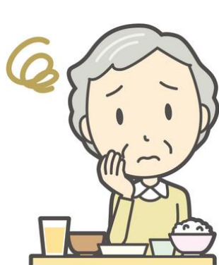
いつもと体調が違う