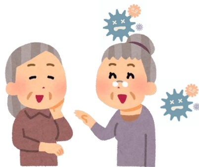
感染者・濃厚接触者 と会う(会話)する