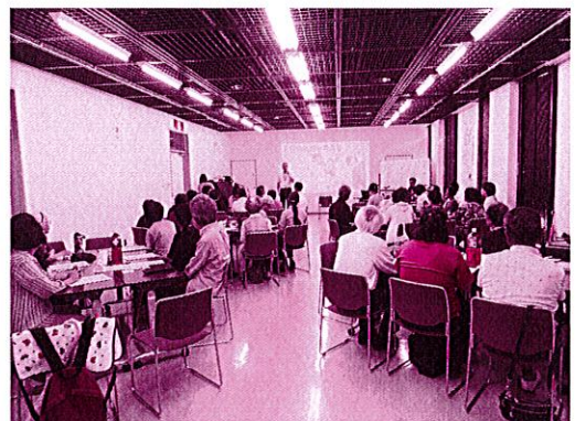
【介護者同士の交流会】